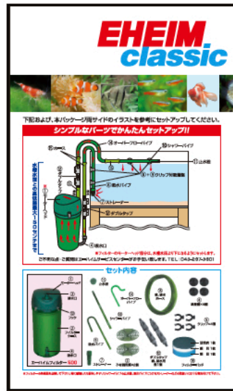
▲パッケージ裏面 完成時のイラスト付き